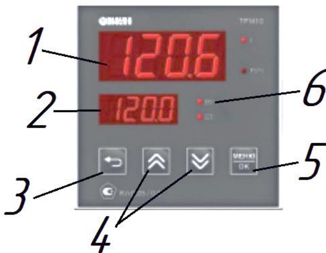
Рис. 2 Блок регулировки температуры

9.1.2 После включения прибора дисплее отобразиться информация о прошивке и предустановленная температура (п.2, Рис. 2);